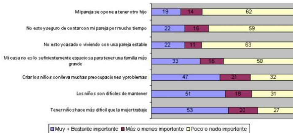
Gráfico Hijos: ¿Cuán importantes son o fueron para Ud. Personalmente las siguientes razones para decidir No tener más hijos?