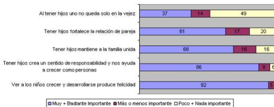
Gráfico Hijos: ¿Cuán importantes son o fueron para Ud. Personalmente las siguientes razones para decidir SI tener más hijos?